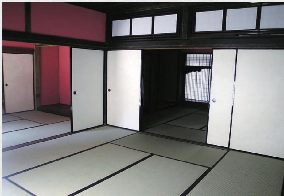
旧田辺邸座敷(佐柿町奉行所遺構)