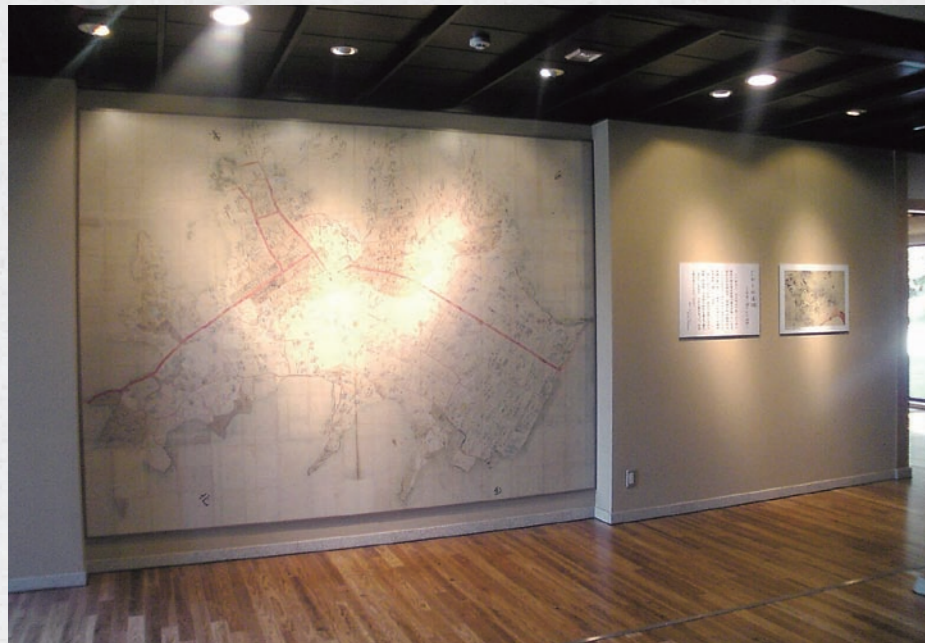
佐柿村絵図(大図)とエントランスホール