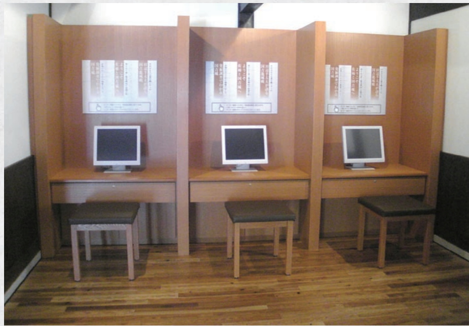
映像展示コーナー