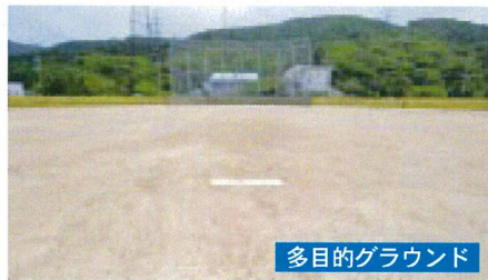
多目的グラウンド