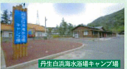
丹生白浜海水浴場キャンプ場

【いずれも問い合わせは】 0770-39-1241 (丹生白浜海水浴場キャンプ場)