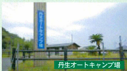
丹生オートキャンプ場

漁港環境広場の周辺には、夏休み期間中営業している、キャンプ場や海水浴場などの施設もあります。ぜひご利用下さい。