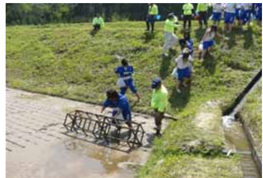
写真3 修学旅行生による田植え

田植え体験では昔ながらの田植杵を転がしての手植えとともに、田植機による機械植えの両方の体験に歓声を上げ、広葉樹林の中の夏の森歩きでは山の豊かさを実感することができた。