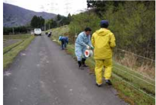
写真1 電気柵の設置

イノシシ、シカ対策として電気柵等を個々で張り対応していたが、現「農事組合法人新庄わいわい楽舎」の構成員が「それぞれ個別でやるよりも、まとまってやろう」と呼びかけ、1戸当たり2万円(45戸)を集めて資材を購入し山際に共同作業で電気柵を設置した。