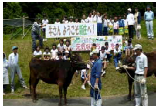
写真4 牛さんようこそ新庄へ！入牧式

春の入牧式では、「牛さんようこそ新庄へ！元氣な赤ちゃんを！」の看板を児童が作り、地元住民とともに歓迎した。秋にはさつまいも収穫で出た芋づるを放牧牛に直接与え牛をなでるなど、ふれあいを行った。そして、冬には生まれた子牛の名前を学年ごとに考え、嶺南牧場を訪問して子牛と対面し「あかり」「美福」などと命名式を行い、命の大切さと、自分の名前をつけてくれた親の想いと愛情を感じてもらうことができた。