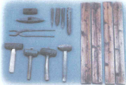
石工の道具(岡崎市美術博物館所蔵)

美浜町では耳川流域や教賀半島のいたるところで花崗岩が露頭しています。縄文時代以後、今日に至るまで私達の暮らしはこれらの石材と深く関わってきました。今回の企画展では、花崗岩をめぐる歴史の一端についてご紹介します。