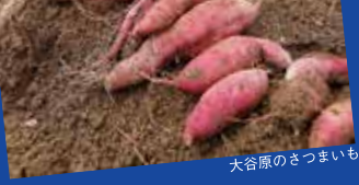
大谷原のさつまいも