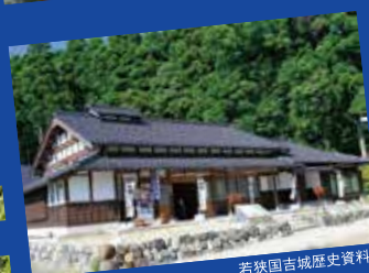
若狭国吉城歴史資料館